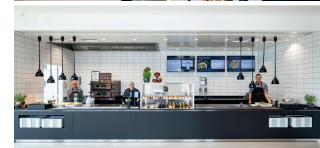
Die moderne Ausgabetheke beim Primuskunden Babor