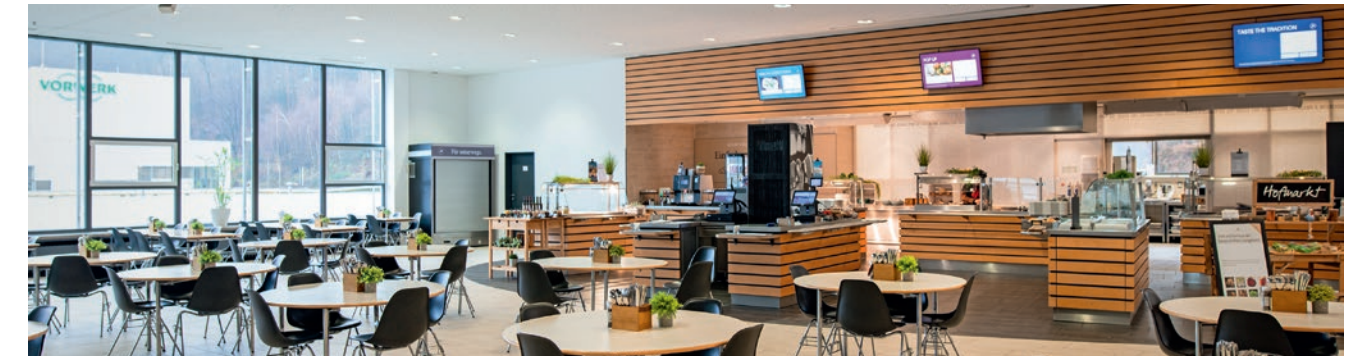
Die moderne und helle Kantine von Vorwerk in Wuppertal. Ein Musterbeispiel für angenehmes Ambiente.

Schnörkellose und nachhaltige Kochkunst mit höchstem Qualitätsanspruch und Fokus auf einen regionalen Einkauf - sowohl im Mittagsangebot als auch im Snacking: Dies bietet unsere Cateringmarke Primus beispielsweise seit August 2023 täglich den 100 Gästen bei der NEW AG in Mönchengladbach - einem gemeinsamen Kunden bei Reinigung und Betriebsverpflegung. Gesunde Verpflegung am Arbeitsplatz, die vegan-vegetarische Gerichte in den Mittelpunkt stellt, leistet einen maßgeblichen Beitrag zur Zufriedenheit der Gäste. Flankiert von einem angenehmen und entspannten Ambiente bietet das Betriebsrestaurant für alle Mitarbeiter:innen und Gäste einen Ort zum Wohlfühlen und Abschalten sowie einen kommunikativen Treffpunkt. So kann die Pause auch mal ganz entspannt für einen Austausch mit Kolleg:innen genutzt werden.