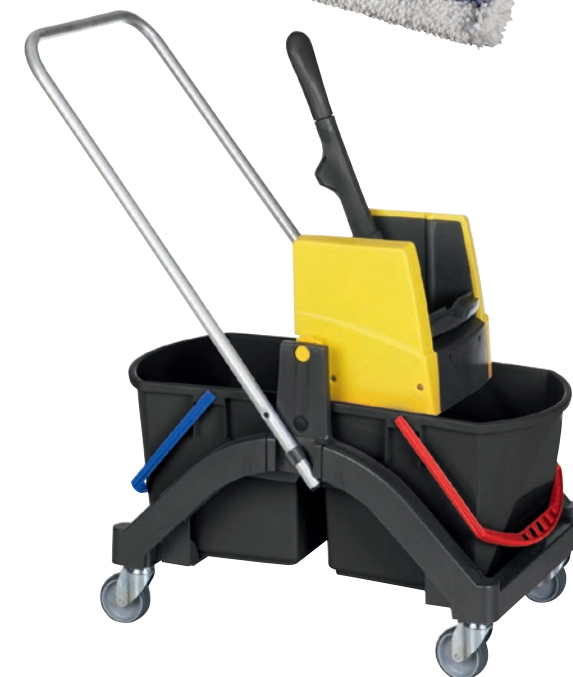
Produkte von VERMOP im Einsatz bei gepe