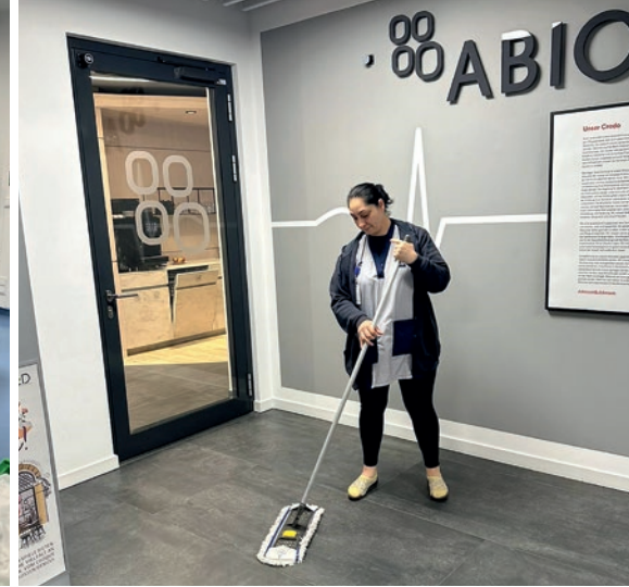
Bild oben links: Unsere Kollegen vor dem Banner des in der Errichtung befindlichen Neubaus von Abiomed. Bild Mitte: Mit erhöhten Hygieneanforderungen erfolgt die Reinigung in der Schleuse vor dem Produktionsbereich.